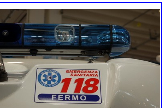
Fermo? speriamo di no