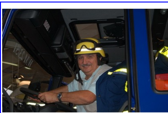
Guido versione sturmtruppen