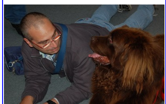
Scambio di opinioni con altre forze di volontariato