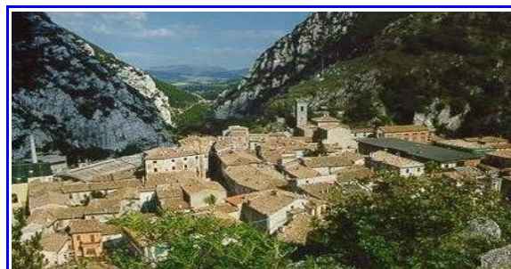
Il paese di Pioraco

Sempre in questo anno, in una riunione di consiglio, il presidente della nostra sezione propone, vista la probabile adesione del comune di Pieve di Cento all'Intercomunale, di modificare il logo per consentire in futuro ad altri comuni di aderire.